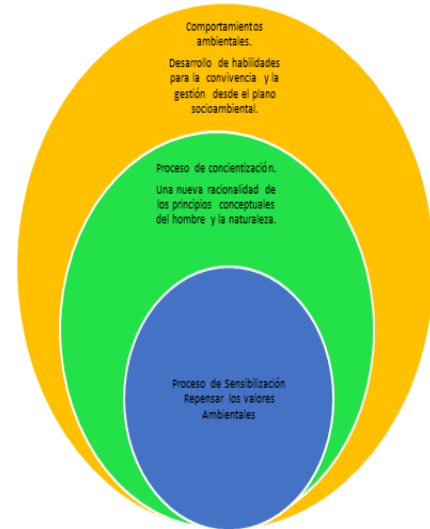
Plano de la intervención de la educación ambiental

La importancia de reconocer los aspectos que aseguran la educación ambiental se sitúan, en el principio de la formación integral del individuo, anteponiéndose a la lógica consumista que determina el estilo de vida actual y que ha sido injustamente impuesta en las distintas sociedades.